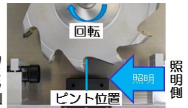
平行光透過照明法による撮影