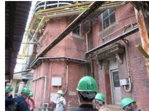
旧呉海軍工廠の施設をめぐる