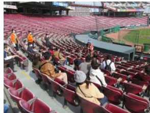
MAZDA Zoom-Zoom スタジアム広島