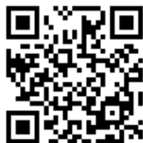
ひろしまたてもものがたりフェスタ 公式ホームページ

（3）ガイドブック：冊子での配付のほか、自由にダウンロードできるようデータを掲載