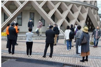
県立広島大学広島キャンパス図書館