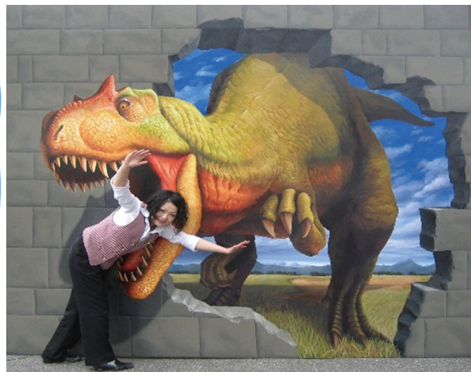
「アロサウルス」