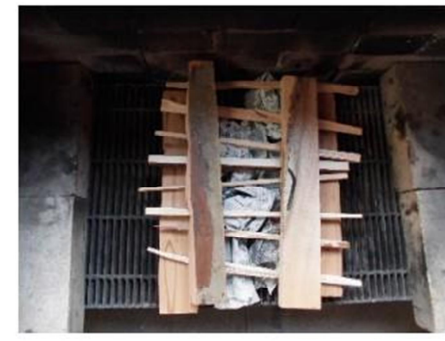
④上の写真のように、今度は少し内側に、薪を2本平行にならべる