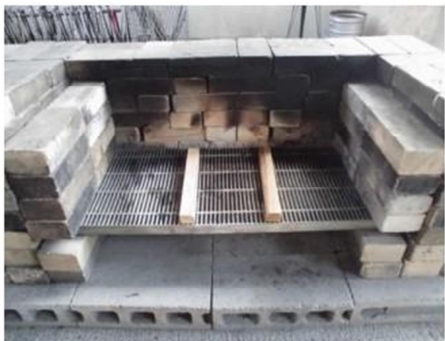
①かまどの中に、薪を2本平行にならべる