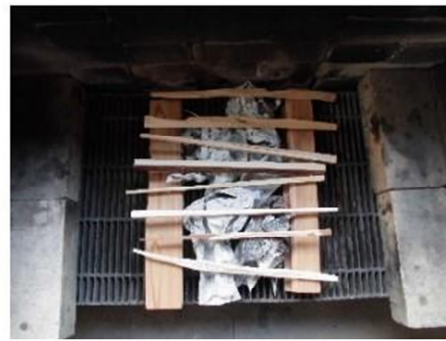
③上の写真のように、細木1を8本ならべる