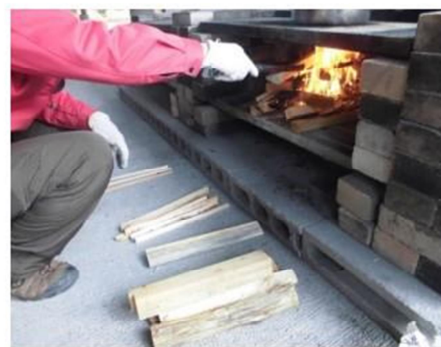
⑦火が広がる様子を見ながら、薪を重ね、火力を調整する