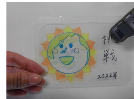
④ パンチで金具を取りつける穴をあける