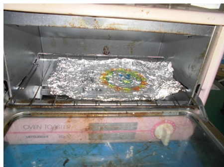
⑤ オーブントースターの中に手でもんで広げたアルミホイルをしき、加熱しておく