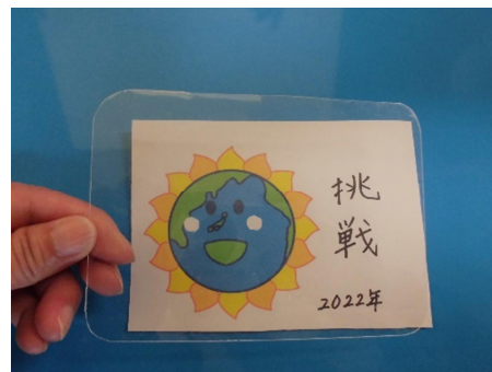
② 下絵の上にプラスチック板を置いてマジックでりんかくをうつす