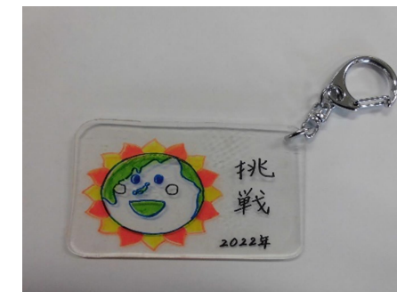
⑧ 金具を取りつけたら完成