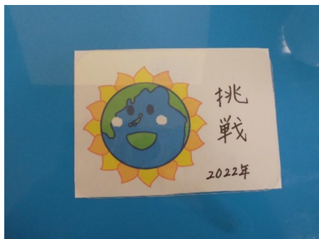
① 紙 (9×13 cm) に下絵をかく