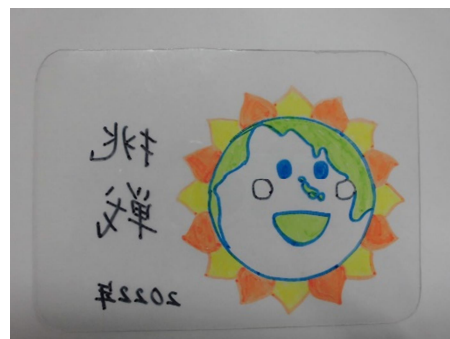
③ プラスチック板に裏から色マジックで色をつける ※色はあまり重ねてぬらない