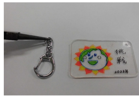
⑦ ラジオペンチで金具の小さいリングを写真のように前後に開いてプラスチック板に取りつける